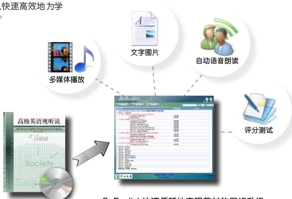
GoEnglish快速低耗地实现教材的网络升级

GoEnglish记录、跟踪教学过程，也为教学评价积累客观数据。教师可根据学生登录平台的学习表现来评分，并且汇入科目成绩。